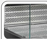
Zone de présentation en acier inoxydable