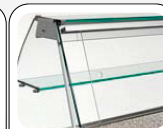
Portes coulissantes arrière